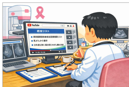
※生成AIで作成した画像です。

【配信開始日 (予定)】 令和8年3月23日 (月曜日) ~ 【開催方法】 動画のオンデマンド配信 (YouTube)