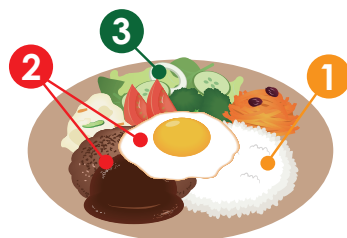
ワンプレートの場合